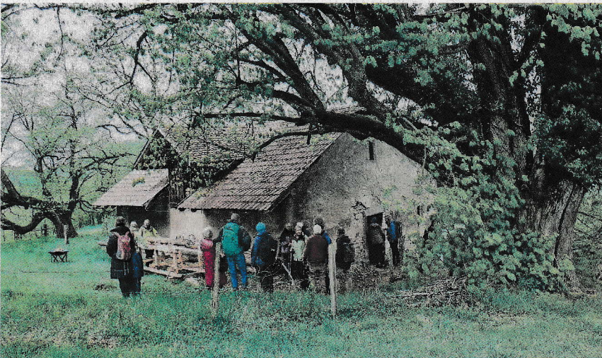
Der Weidstall Rütiboden liegt zwischen den Höfen Rüti und Reisen südwestlich von Wisen.

Die kleine Wanderung mit grosser Wirkung für Leute mit offenen Sinnen für unsere Oberbaselbieter Kulturlandschaft war durchzogen von Humor, feiner Verpflegung vom Fassgrill und Konditor-Crèmeschnitten, traditionell mit Vanilleschoten statt mit Waldmeister hergestellt.