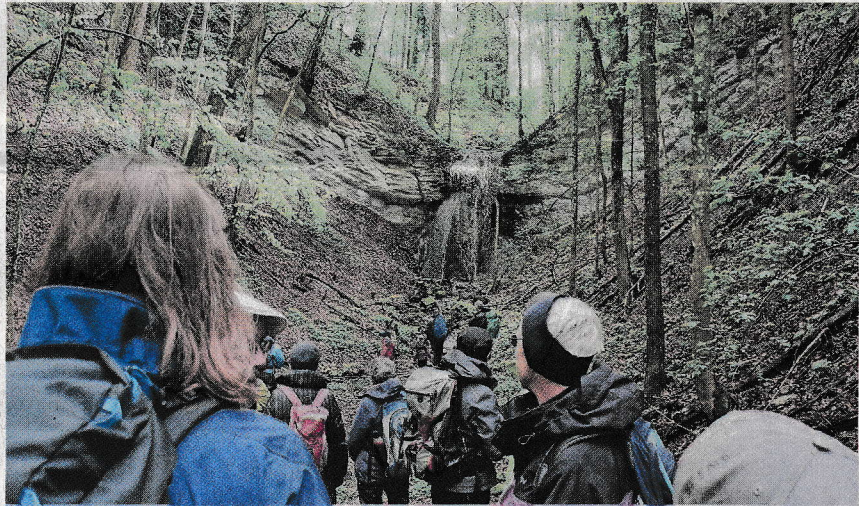
Wasser war das Thema der geführten Wanderung, hier am Wasserfall des Murenbach.